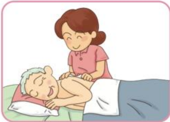
床ずれの予防、手当