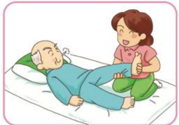
家庭での簡単なリハビリ、 作業療法のお世話