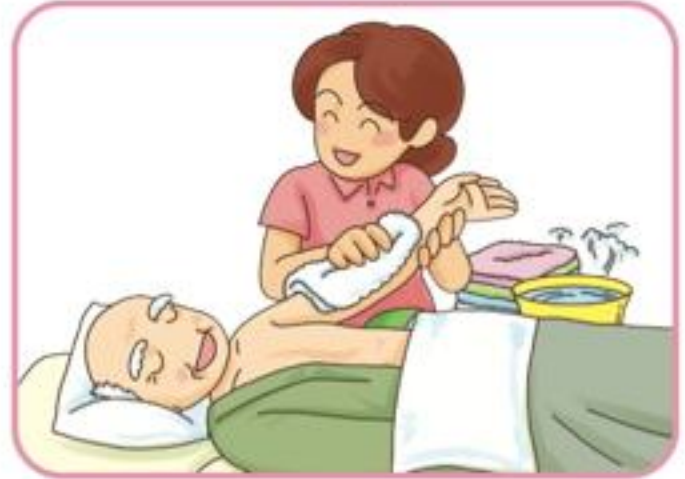
からだの清潔援助（清拭・洗髪）